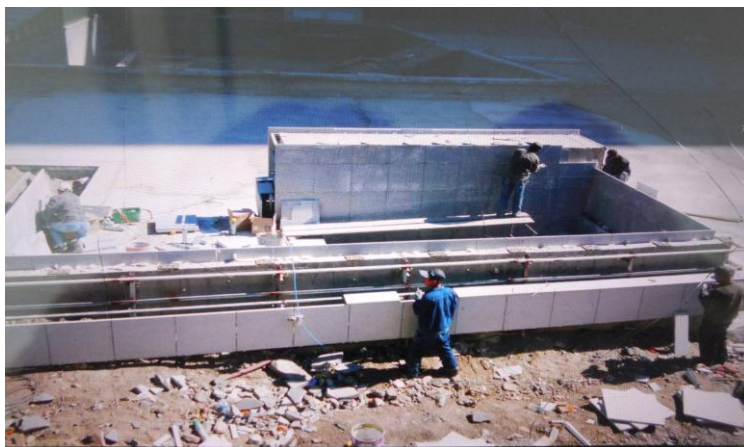
车库出屋面小房干挂理石