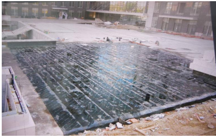
车库屋面防水粘贴