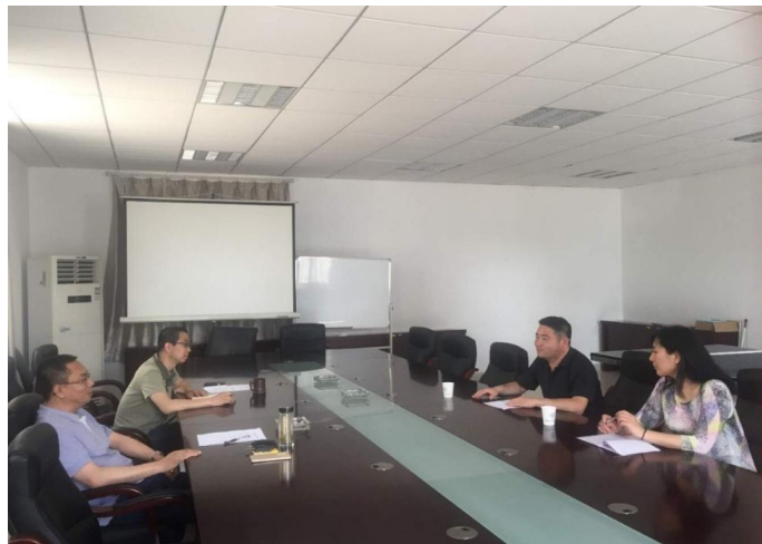
到南京航空航天大学调研