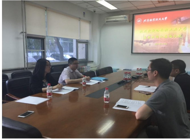
到北京航空航天大学调研