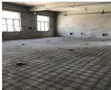
室内地面钢筋绑扎