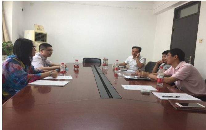
到北京理工大学调研