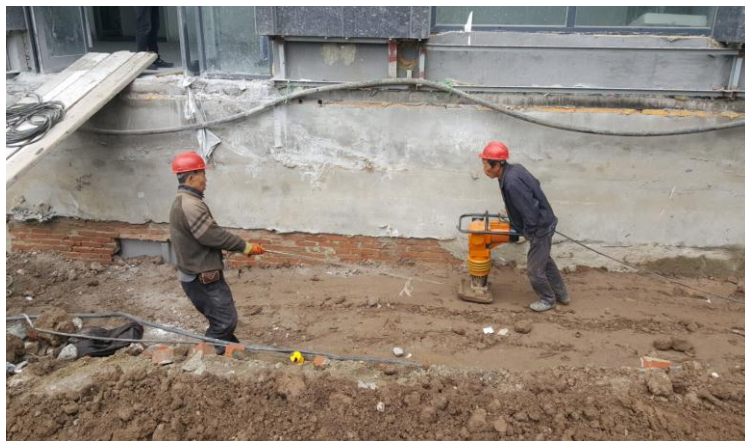
散水坡下换填二八灰土