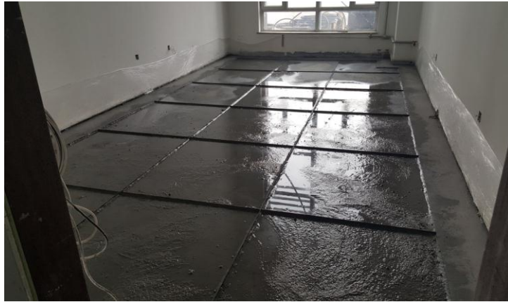
一层水磨石安装铜条