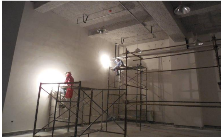
地下室墙面大白施工